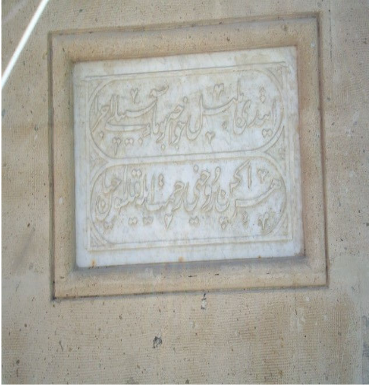
Çeşme damı'nın kitabesi